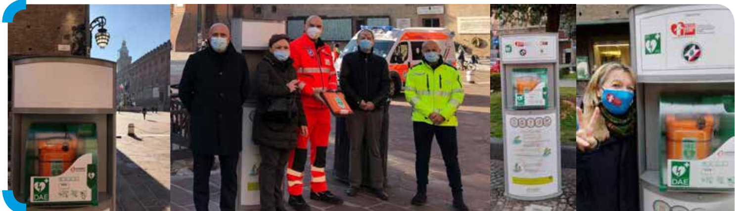
Nelle foto: Progetto APGC "Bologna Città Cardioprotetta" installazione dei primi 3 Defibrillatori semi-Automatici Esterni (DAE) a Bologna.